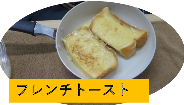
フレンチトースト

ご自宅でお料理を楽しくできることを目標にされているお二人が、当施設のキッチンを利用しお料理練習をしました。いろいろと工夫をしながら、上手に取り組みられましたね。